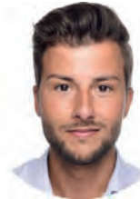
Fred Oliveri Cantel (Germany) GmbH